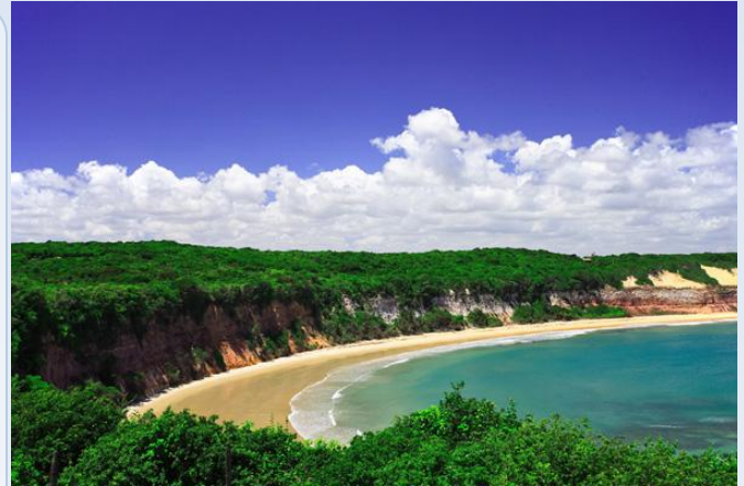
[Vista da praia - PIPA - RN]

Faça já a sua inscrição. falecom@xplorar.com.br