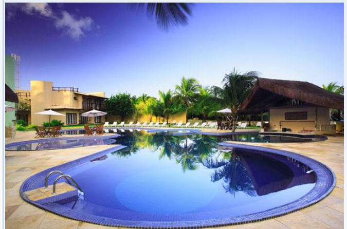
[Vista da piscina Pipa Ocean View]